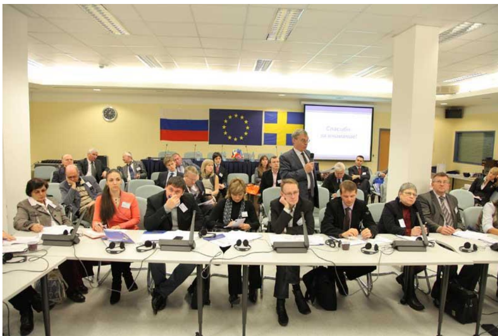
Рис. 2. Фото реализации программ Tempus

что ранее реализуемые программы международного сотрудничества вузов-участников Tempus охватывали очень широкий круг вопросов, среди которых совместные программы (двойных или совместных дипломов уровня бакалавра и магистра) составляли только 23%.