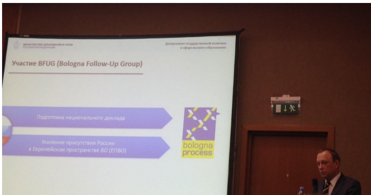
Рис. 1. Выступление директора департамента государственной политики в сфере высшего образования Министерства образования и науки РФ Соболева Александра Борисовича, 9 октября 2014 г., Москва

интернационализация содержания программ, совершенствование систем обеспечения качества. Эти задачи могут быть решены на основе формирования корпуса менеджеров для реализации в вузах совместных программ, решения организационных вопросов (службы в вузах по сопровождению участников мобильности), обеспечения финансирования этих проектов, проектирования современных образовательных технологий.