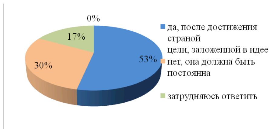
Рис. 3. Результаты ответов на вопрос: «Должна ли национальная идея меняться со временем?»

(составлено авторами на основании проведенного анкетирования, май-июль 2015 г.)