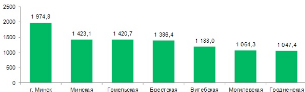
Рисунок 1. Численность населения Республики Беларусь по областям и г. Минску Беларусь по состоянию на 1 января 2017 года [5]

При этом по регионам республики численность населения распределилась следующим образом (рисунок 2).