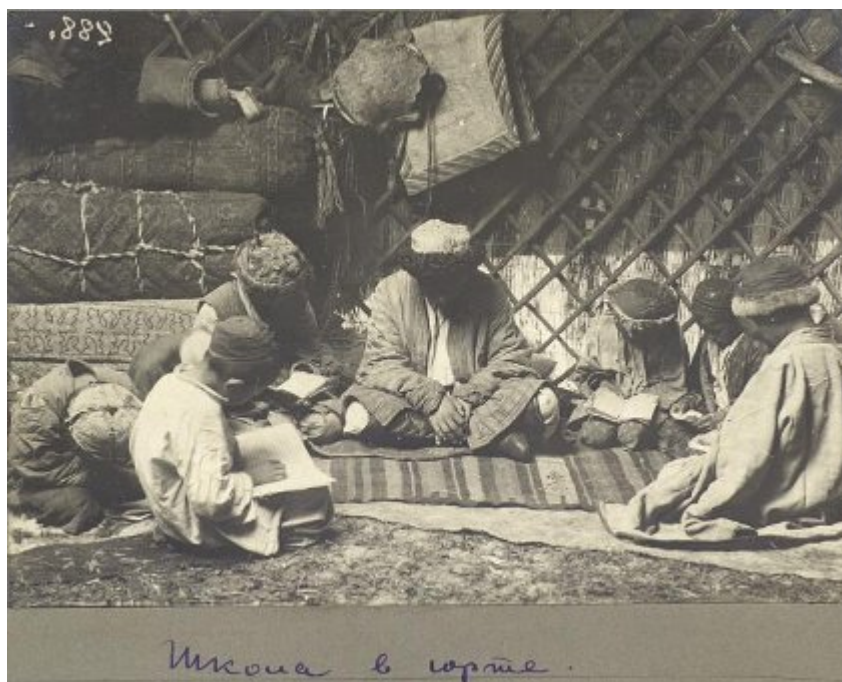
Школа в юрте.

(казахской - Т.Д.) степи расстоянием от крепости Пресновской в 250 верстах при горе Сырымбет» [3, Л. 1-2]. В январе 1827 г. старшине ИтекеЯндосову пришел ответ с разрешением «...попеременно проживать у него сим татарам с узаконенными письменными видами от своего местного начальства; с тем, дабы они показывали киргизам хлебопашество, и детей их обучали грамоте»[2, Л.13-13 об.]. В первое десятилетие после принятия Устава 1822 г. особых препятствий для организации школ в степи и привлечении татар для обучения детей не было.