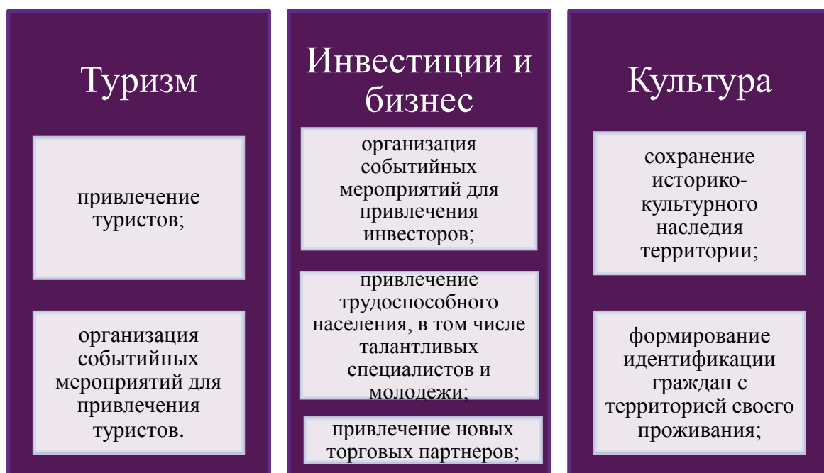
Рис 1. Классификация задач брендирования Белгородской области

Приоритетными задачами в брендировании Белгородской области являются (рис 1.):