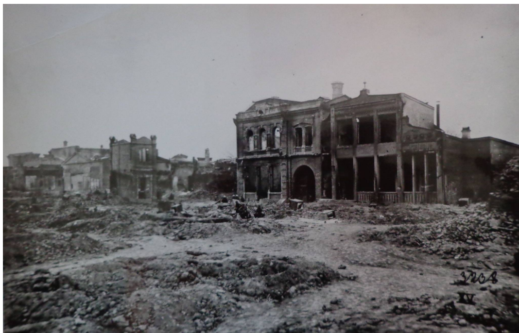
Коканд после разгрома автономии. 1918 г.

практической конкретизации форм федерации в случае с Туркестаном фактически оказались крайне слабыми. «Европейское» население Коканда оставалось сторонним наблюдателем. Вкупе с перманентной борьбой за власть в регионе и острой конкуренцией всех ее участников, радикализмом местных большевиков и неопределенностью в отношениях с Петроградом автономия была обречена.