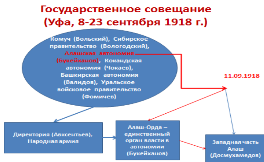
Рис.2. Государственное совещание (Уфа, 8-23 сентября 1918г.)

Уральской области ханство «Уильскийоляят». По инициативе Букейханова в дни совещания полномочия единого центра автономной власти были подтверждены специальным решением алашординцев. Уильскийоляят стал составной частью автономии, а не самостоятельным юридическим образованием, что укрепляло статус Алаш-Орды как легитимного представителя всех областей, включенных в состав автономии.