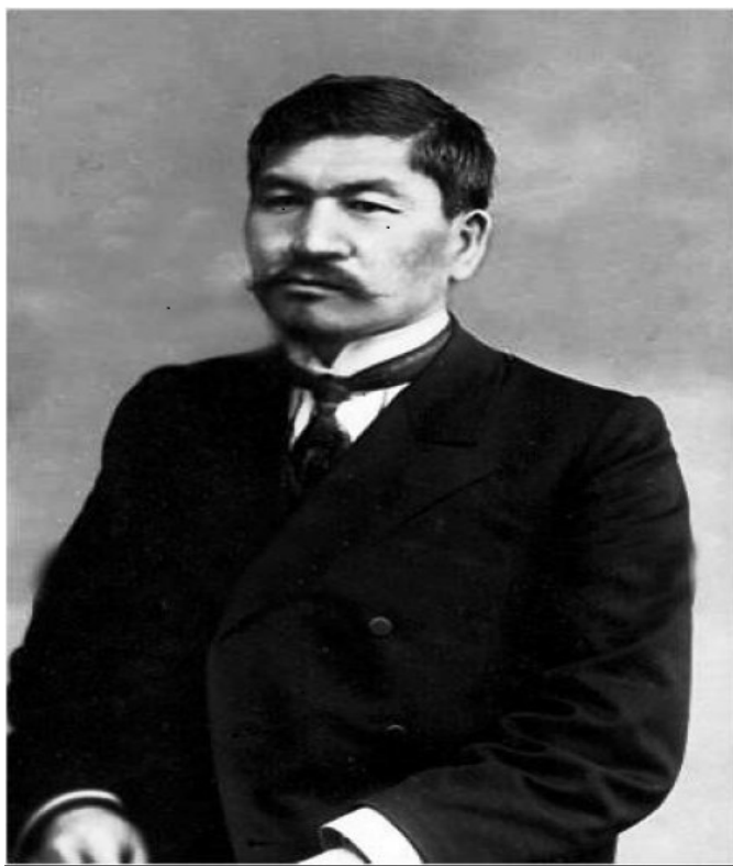
А.Букейханов (1866-1937). 1906 г.

решением 2-го съезда. Еще в январе 1918 г. алашординцы не предпринимали попыток перейти от декларации к делу. Сыр-Дарьинский казахский съезд высказался за оставление области в составе Туркестанской автономии.