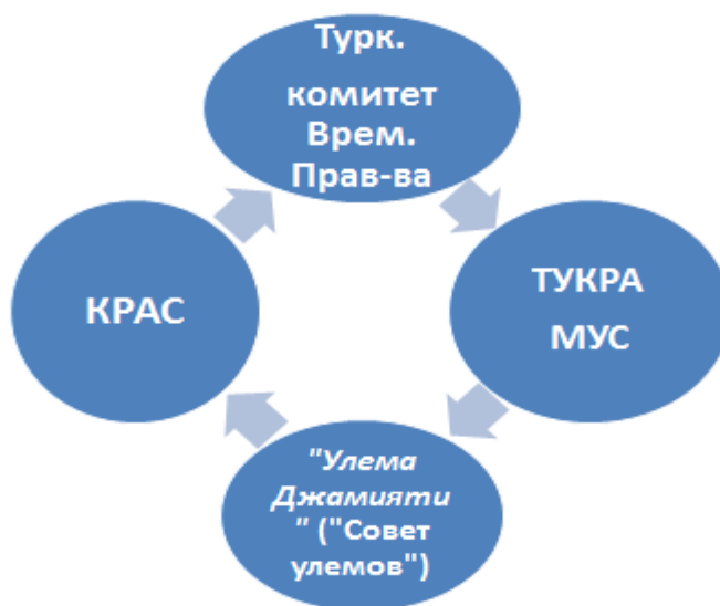
Рис. 1. 1917 год в Туркестане

Идея автономии в мусульманском политическом классе Туркестана была озвучена летом 1917 г., и толчком послужил информационный повод: известие о создании на Украине Центральной Рады.