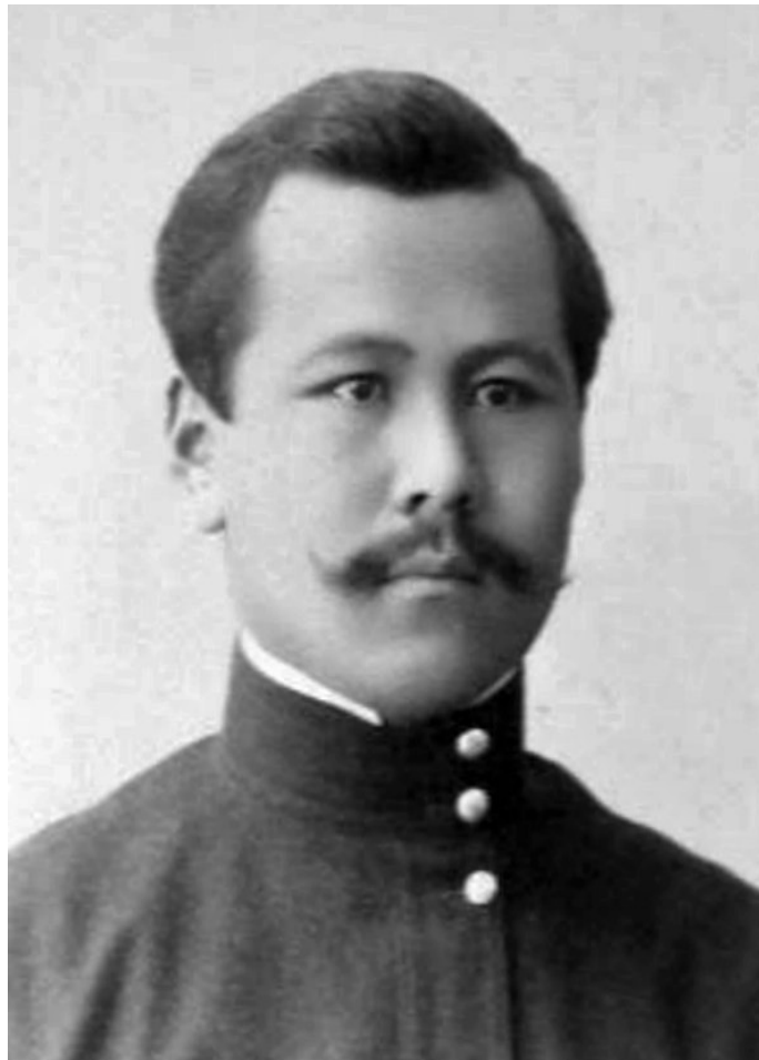
М. Чокаев (1890-1941)

Туркестанская автономия, ставшая результатом протеста полиэтничной национальной элиты при поддержке коренного населения, опиралась больше на общественные ожидания, нежели на заранее выработанную программу. «Чувство неудовлетворенности настоящим и жажда перемен», объединявшие весь политический актив Туркестана – от джадидистов до кадимистов[2.С.282], оказались недостаточными для овладения властью. Партийные этнополитические институты также не получили оформления в предшествующий период. Финансы кокандцев были крайне ограничены, а вооруженные силы не успели организовать. Границы автономии в документах ее инициаторов не определялись, подразумевая, очевидно, прежнее пространство Туркестанского края. Не нашлось у автономистов и надежных союзников, как и «внешних» партнеров, готовых поддержать этот проект, да и в самой «команде» руководителей единодушия не было. Горизонтальные связи для выяснения этнических территорий, их границ и