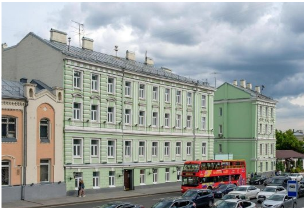
Рис.2. Гостиница «Veliy Hotel Mokhovaya Moscow»

расположена в четырехэтажном здании, находящемся по адресу ул. Моховая, 10, стр.1 в десяти минутах от Красной площади (рис.2) [3].