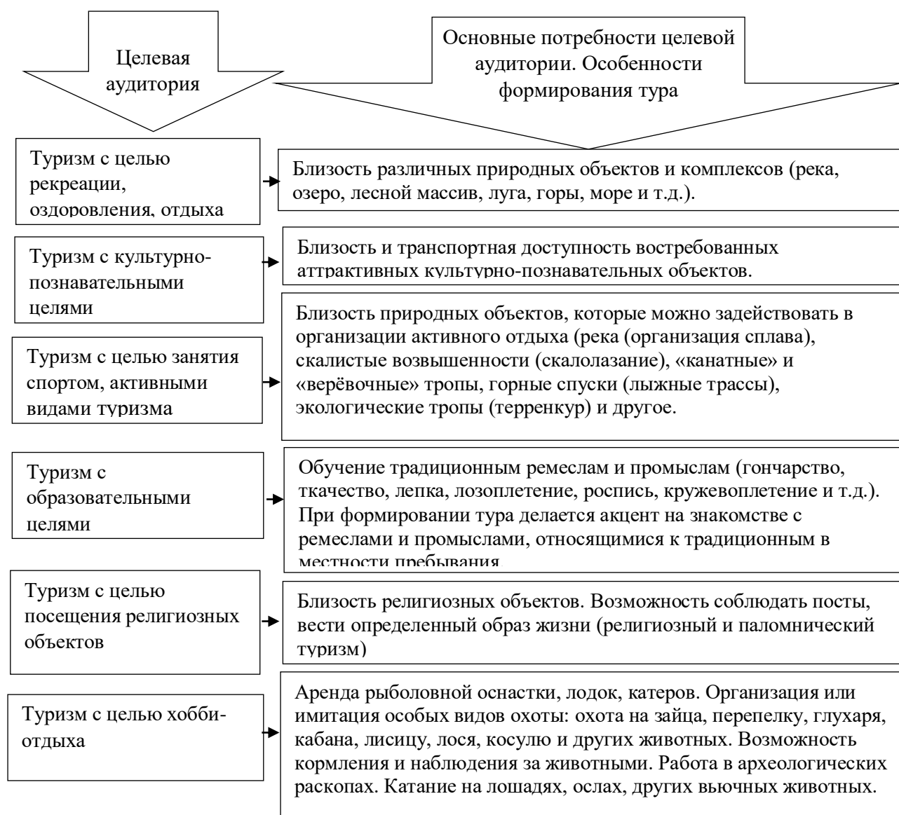
Рис. 1. Классификация потребителей услуг сельских гостевых домов по целям туризма (разработано автором)

Эта авторская методика классификация туристов, приезжающих на отдых в сельские гостевые дома, может использоваться для проведения аналитических исследований деятельности сельских гостевых домов.