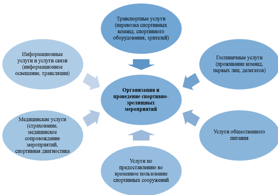
Рис. 4. Взаимосвязь услуг организации и проведения спортивно-зрелищных мероприятий с другими видами услуг

Таким образом, современным спортивным услугам, особенно услугам организации и проведения спортивно-зрелищных мероприятий, свойственен комплексный характер, заключающийся в том, что основная услуга потребляется неразрывно от дополнительных и сопутствующих услуг: гостиничных услуг (проживание участников спортивно-зрелищного мероприятия), транспортных услуг (трансфер участников спортивно-зрелищного мероприятия и оборудования), услуг общественного питания (организация питания участников спортивно-зрелищного мероприятия) и т.д.