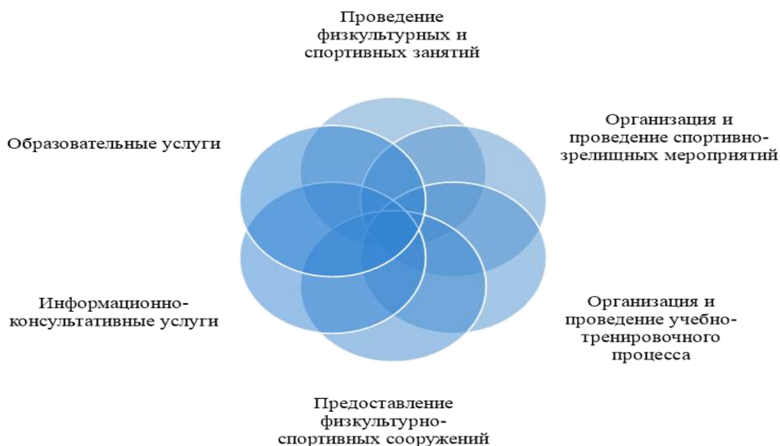
Рис.2. Основные виды спортивных услуг (составлено автором)

комфортность, безопасность и т.д. Основные виды спортивных услуг схематично изображены на рисунке 2.