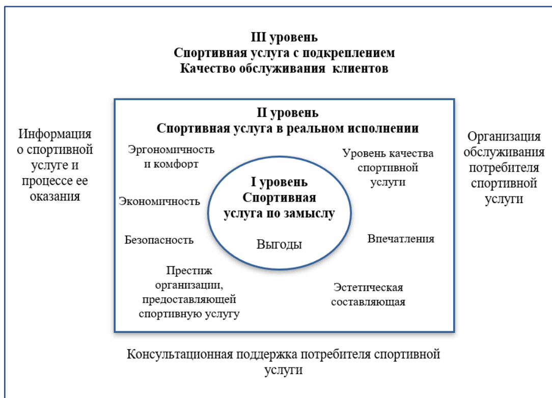
Рис. 1. Три уровня спортивной услуги (составлено автором)

Рассмотрим содержание каждого уровня спортивной услуги: