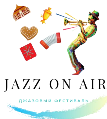
Рис.2 Логотип джазового фестиваля JAZZ ON AIR