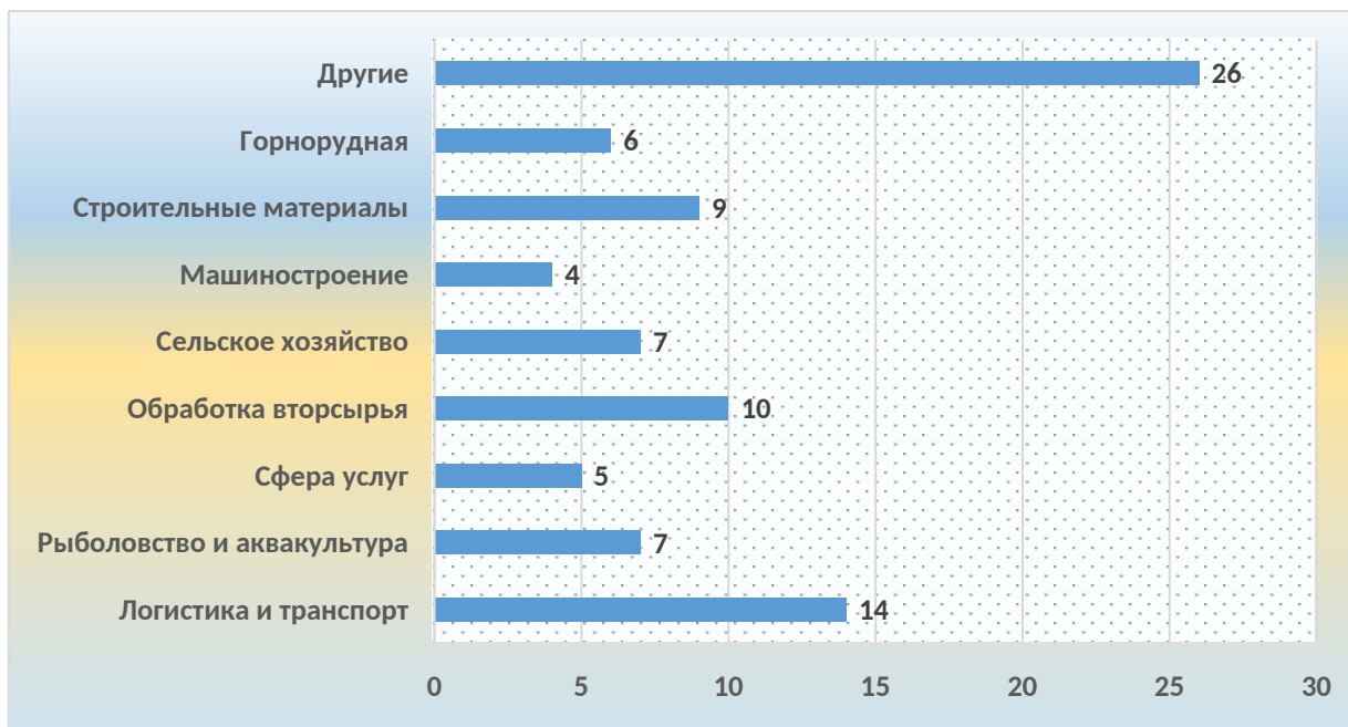
Рис. 2. Отраслевая направленность TOP Хабаровского края

(10 резидентов), затем идут строительные материалы, рыболовство, сельское хозяйство и горнодобывающая отрасль (рис. 2)