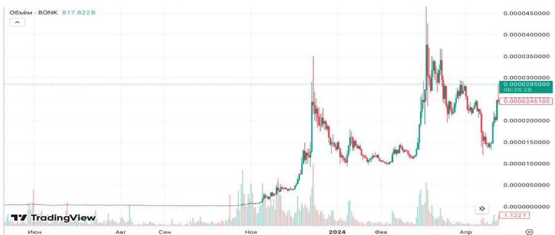
Рис. 2. Курс Bonk к доллару за период 2023-2024 гг. [7]

Определенном лидером роста среди цифровых валют за 2023г. стала Bonk (BONK), показав рост на 7302,9%.