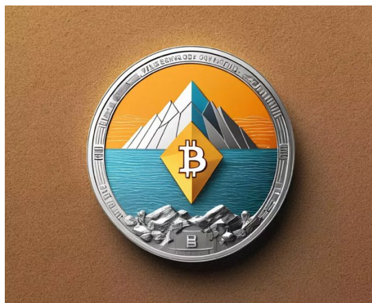
Рис. 4. Логотип TravelCoin

разработки возможного логотипа этого проекта поддерживает концепцию инновационных решений в инвестиционном секторе туристской индустрии.