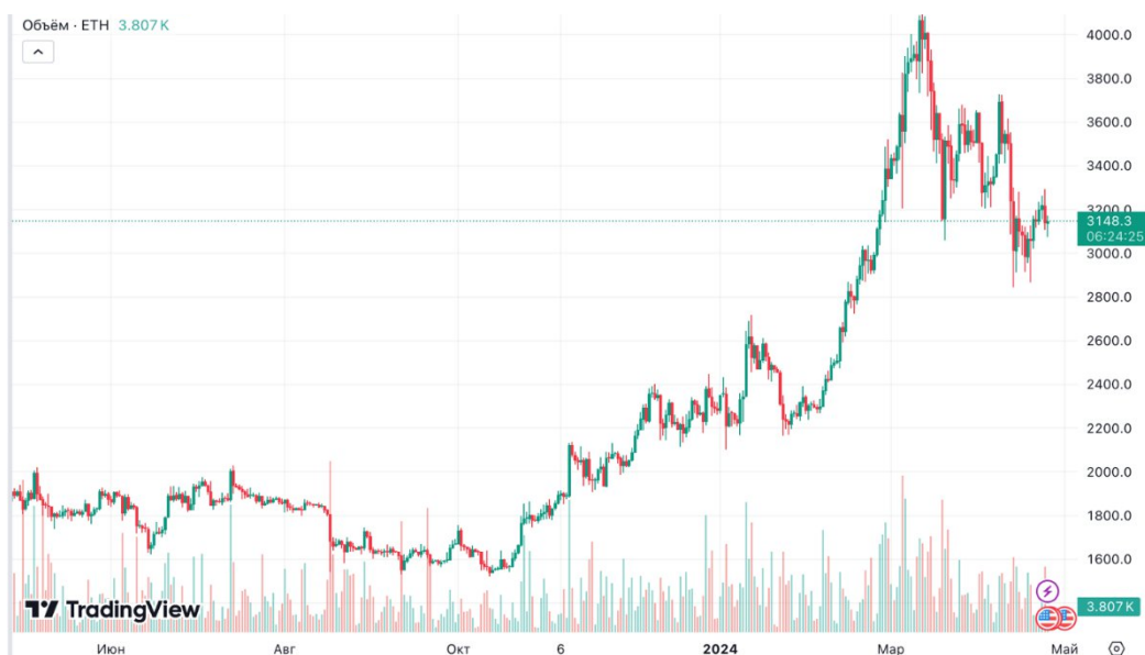
Рис.1. Курс эфириума к доллару за период 2023-2024 гг. [7]

Сравнивая традиционные методы инвестирования и инвестирование в криптовалюту, можно сравнить их рост. К примеру, возьмем индекс МосБиржи, так как именно эти акции включают все акции крупных компаний, создавая тем самым портфель, и индекс МосБиржи за год в период с марта 2023г. По март 2024г. вырос на 36,23%. В свою очередь криптовалюта может показывать такие результаты за месяц и даже неделю, как правило, около 20% в среднем растет криптовалюта за неделю.