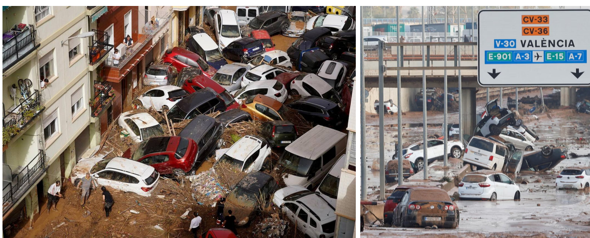
Рис. 1. Последствия проливных дождей 30.10. 2024 г. в Валенсии (Испания) 4

В качестве примера рассмотрим одно из недавних событий в Испании, когда в Валенсии 30-го октября за один день выпала практически годовая норма осадкой. В результате таких проливных дождей эта провинция оказалась отрезана от остальной части страны, так как многие мосты и дороги были обрушены, а железнодорожные пути выведены из строя (рис. 1).